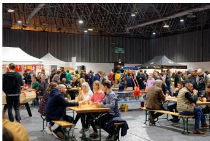
Soirée Festive 2022